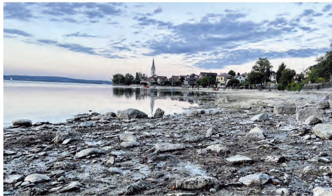
16. August 2022: Ein für die Sommersaison noch nie dagewesenes Bild dokumentiert den Niedrigwasserstand.

(eb/jb) Aus der Perspektive von Berlingen müsste die Untersee- und Rheinschiffahrt einem Rekordjahr entgegensehen. An der Anlegestelle, wo sich die Kurse kreuzen, wirkten die Schiffe immer ausgebucht. Aber der Schein täuscht, wie Oberkapitän Urs Thaler, Tägerwilten, weiss: Die URh war kurz vor dem Auflaufen – bis zum seit langer Zeit ersten Regentag, der immerhin rund 30 cm Wasser brachte und die Situation für den Moment deutlich entspannte.