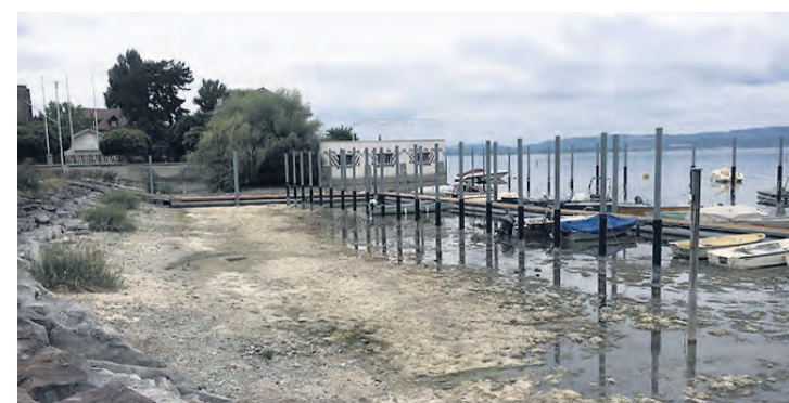
An den Gondelstegen und in den Bojenfeldern mussten viele Boote «umparkiert» oder schon ausgewässert werden.

Am Untersee verlängert die URh auch 2022 die Saison und schickt ihre Flotte an den Wochenenden vom 8./9., 15./16., 22./23., 29./30. Oktober und 5./6. November auf Rundkurs. Die vier täglichen Rundfahrten dauern jeweils zwei Stunden. Ein- und Ausstieg ist an jeder Landestelle möglich. Befahren wird die Strecke Mannenbach–Berlingen–Gaienhofen–Hemmenhofen–Steckborn–Radolfzell–Reichenau–Mannenbach.