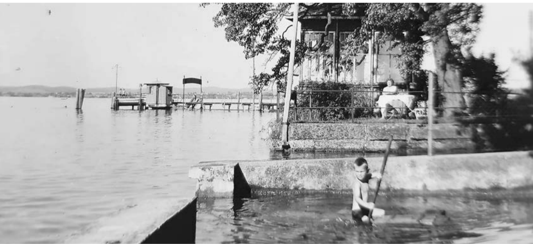
Vor der Aufschüttung: Blick vom alten Chloose-Areal Richtung Stedi mit Hochwassersteg. Im Hintergrund das Seehüsli vom Hotel und Pension zur Post.

zwischen Berg und See beschränkt war, pachteten sich unsere Vorfahren zum Teil Land in Radolfzell. Da wo das Flüsslein Aach in vielen Windungen seewärts fliesst, konnten sie das von einer Schlaufe eingeschlossene Land (Bügen genannt) pachten. Das darauf produzierte wurde mit Booten heimgefahren. Die Kriege machten dem kleinen Grenzverkehr ein Ende. Nun waren die Häuser zwischen Seestrasse und See keine Landwirtschaftsbetriebe im eigentlichen mehr. Es fehlte der Platz für eine Scheune. Das Parterre beherbergte den Stall, das Futterhaus, den Keller mit Obstpresse, Mostfässern und Hurden zum Einlagern von Früchten. Heu und Stroh wurden durch die Estrich-tore gezogen. Als ich in den späten 1960er-Jahren auf einem Heimaturlaub beim Grundbuchverwalter Schmied vorsprach, um den Status unseres Seeanstosses zu prüfen, stand da: Nordgrenze Untersee. Ob das je geändert worden ist, entzieht sich meiner Kenntnis.»