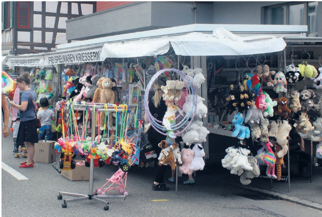
Die Chilbi ist für alle da und lockt mit Spielzeug auch die Kleinsten an.

Die Chilbi ist auch ein Treffpunkt für Einheimische und Gäste, die sich «zufällig» wiedersehen und Erinnerungen auffrischen. Alle Restaurants im Dorf haben über die Chilbitage ab 11 Uhr geöffnet. Ein besonderes Highlight ist das traditionelle Kartenspiel 'Bethlen', zu dem sich Stammgäste am Montagnachmittag im Garten des Gasthauses Hirschen treffen.