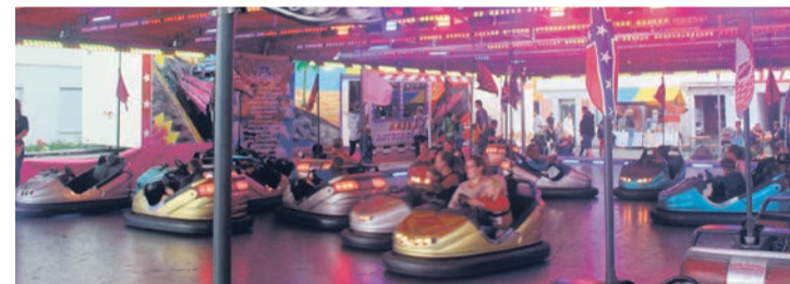
Nach wie vor im Mittelpunkt: die Autoscooter.

(Red.) Zu den rund 30 Anbietern zählt neu auch die Männerriege Berlingen, welche die Tradition der Fischchmusperli-Beiz vor dem Seehus weiterführt. Neu gibt es einen