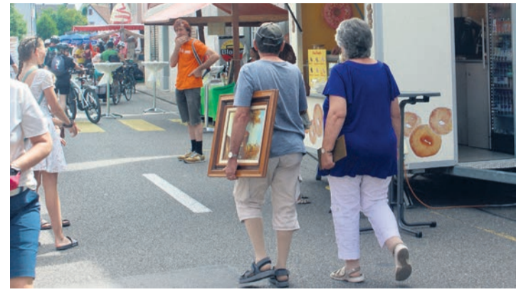
Schnäppchen vom Flohmarkt machen Freude.

Bis spät in die Nacht kann man an der Berlinger Chilbi gesellig zusammensitzen, bevor die Strasse am Dienstagmorgen wieder dem Verkehr gehört.