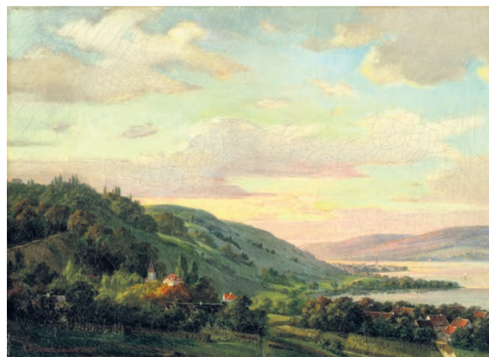
Und so wie auf diesem Gemälde von Émile-Henri Brunner-Lacoste zeigte sich die Szenerie auf Schweizer Seite.

Mit ein bisschen Phantasie kann man aber auch hier und heute noch vom Schloss Arenenberg auf den Untersee blicken, einen Schluck Arenenberger geniessen, kurz die Augen schliessen und wehmütig der Amalfi-Küste mit dem Vesuv «en miniature» eine Träne nachweinen.