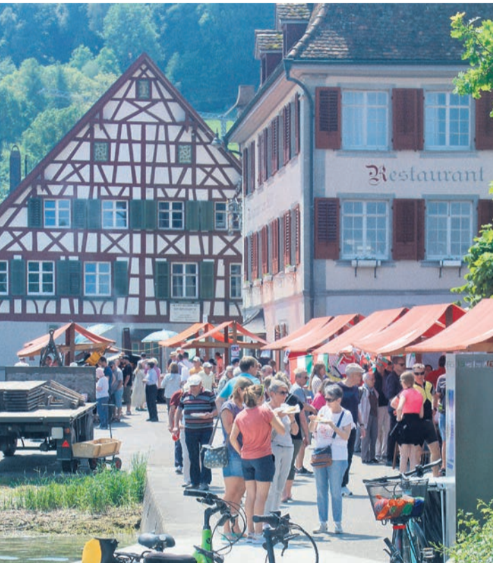
Der Ansturm auf die Stände setzt in der Regel schon früh ein.

Am kommenden Pfingstsonntag mit kulinarischen Köstlichkeiten aus aller Welt