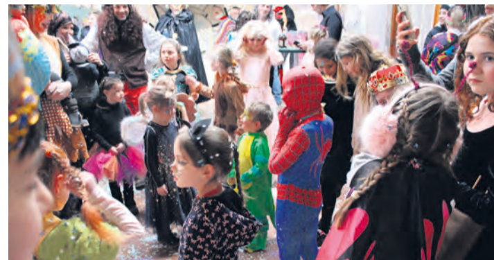
Jubel, Trubel am Kindermaskenball nach dem Umzug.