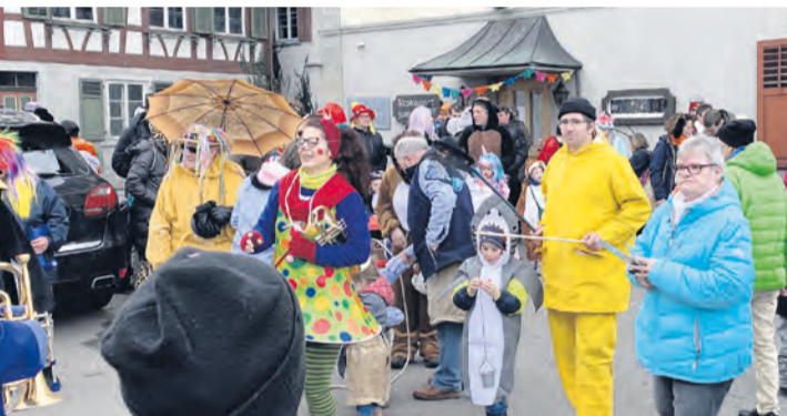
Klein und Gross im Fasnetfieber auf dem Stedi.

Montag, 10. März, 16.30 Uhr: Schnitzelbank mit Eselingers Töchter im Bodenseehotel Abends Beizenfasnet mit Schnitzelbank der Eselingers Töchter: 20.00 Uhr Hirschen 21.00 Uhr Schiff Für Stimmung sorgen die Heugümpers & Velopümpers