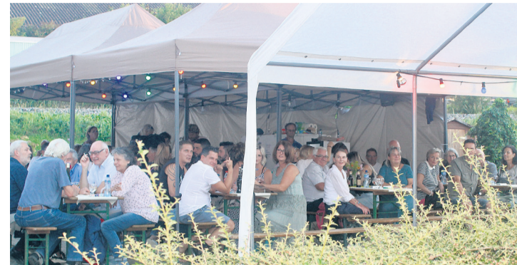
Volles Haus bei den Wild Donkeys (heuer zusammen mit dem Popchor Untersee) im Mannwerk.