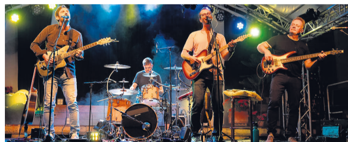
Die Chasing Mondays in «full action»

(Über die Musik des am 26. Oktober 2024 gleichenorts auftretenden Meraki Sextetts informiert u.a. die Website www.thurgaukultur.ch .)